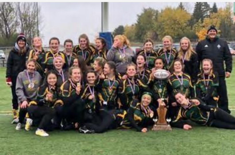
Equipo femenino de rugby de "Centennial School".