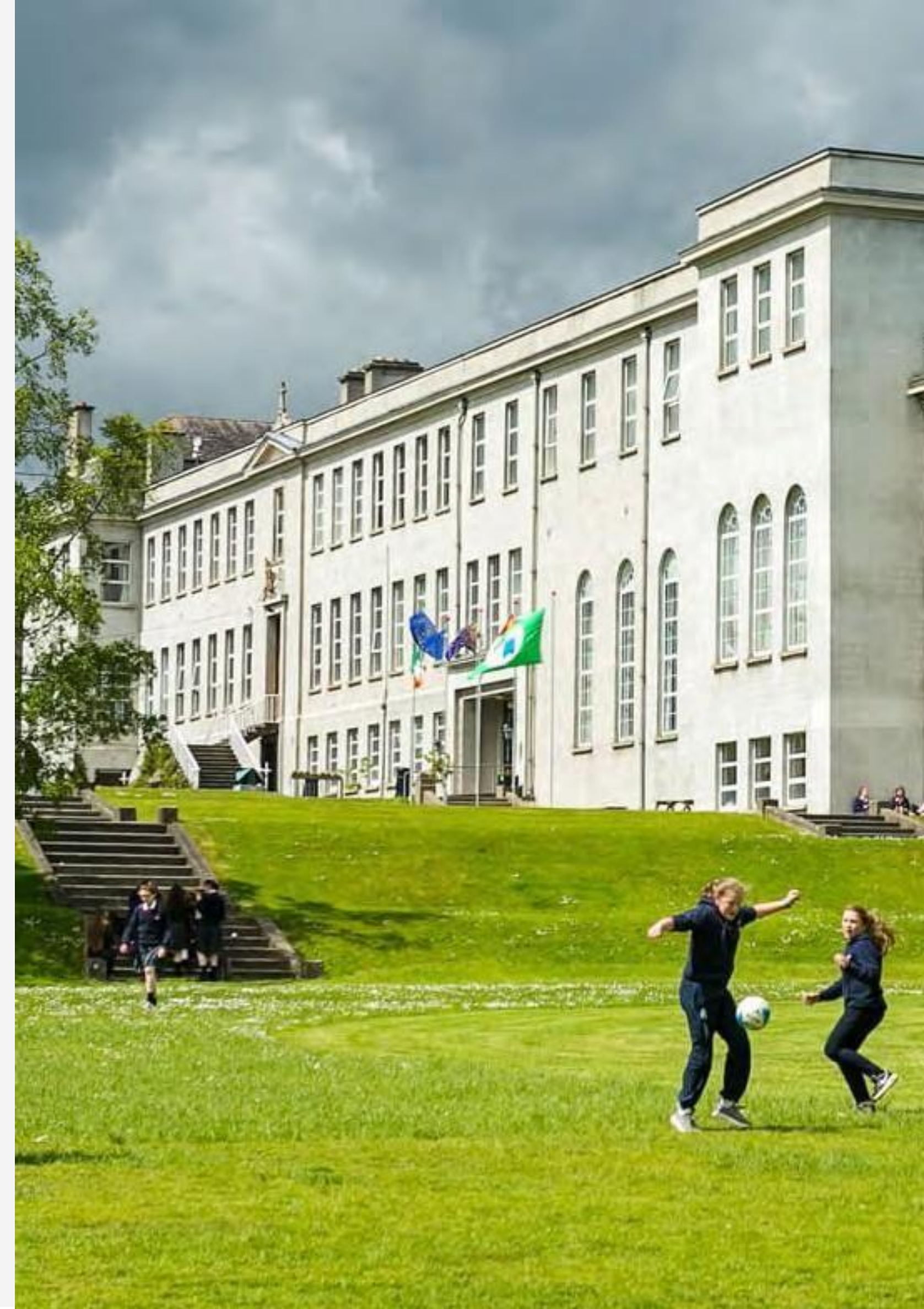
Colegio público St Mary's College, Arklow, Wicklow.